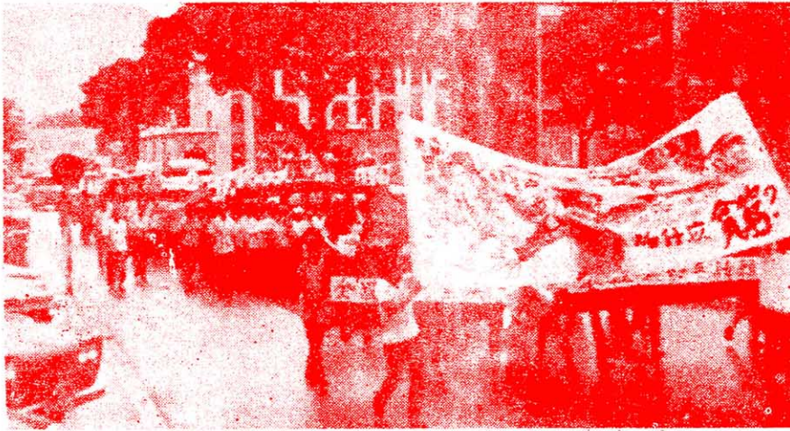
各工團支援亞沙漢工潮的壯大隊伍