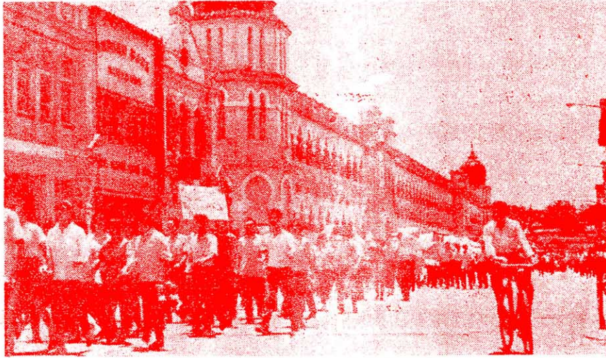
真理正義面前挺起胸，強權暴力下不低頭。